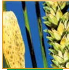
Septoriose de l'épi